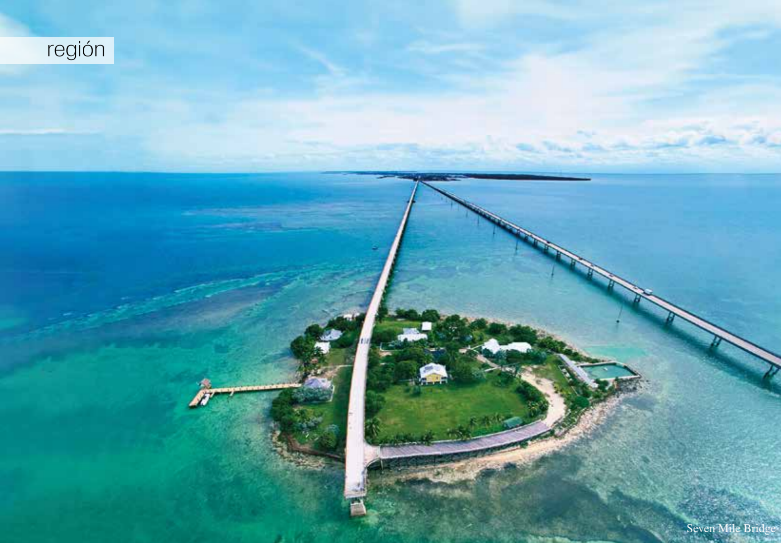
Seven Mile Bridge