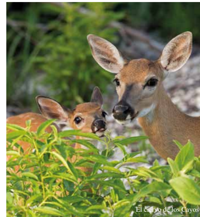
El ciervo de los Cayos