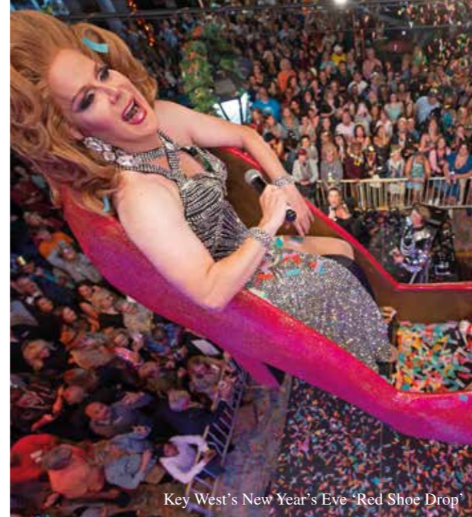
Key West's New Year's Eve 'Red Shoe Drop'